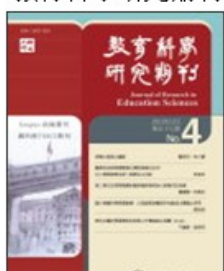
期刊介紹 線上投稿