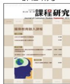
期刊介紹 線上投稿