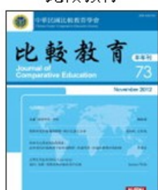
期刊介紹 線上投稿