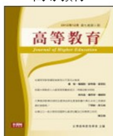
期刊介紹 線上投稿