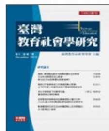
期刊介紹 線上投稿