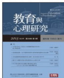
期刊介紹 線上投稿