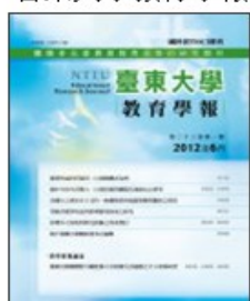
期刊介紹 線上投稿