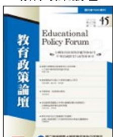
期刊介紹 線上投稿