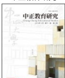
期刊介紹 線上投稿