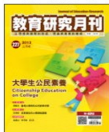
期刊介紹 線上投稿