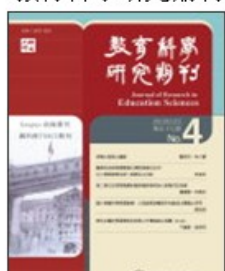
期刊介紹 線上投稿