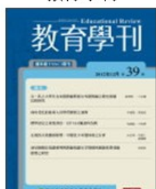
期刊介紹 線上投稿