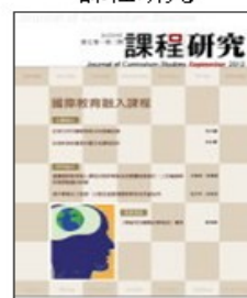
期刊介紹 線上投稿