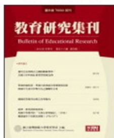
期刊介紹 線上投稿