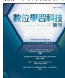
期刊介紹 線上投稿