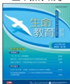
期刊介紹 線上投稿