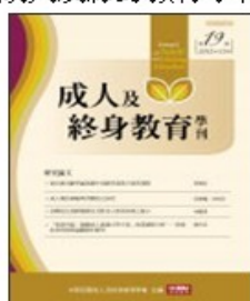
期刊介紹 線上投稿