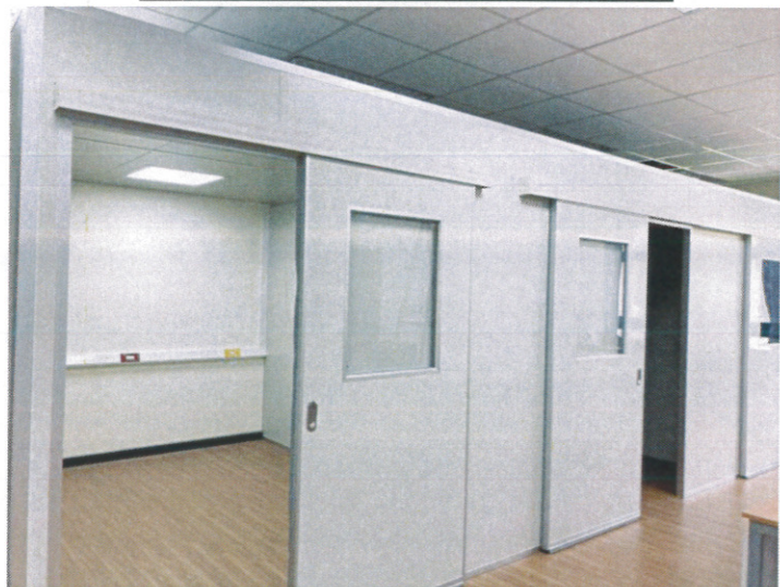
EEG 應用艙、語言訓練室